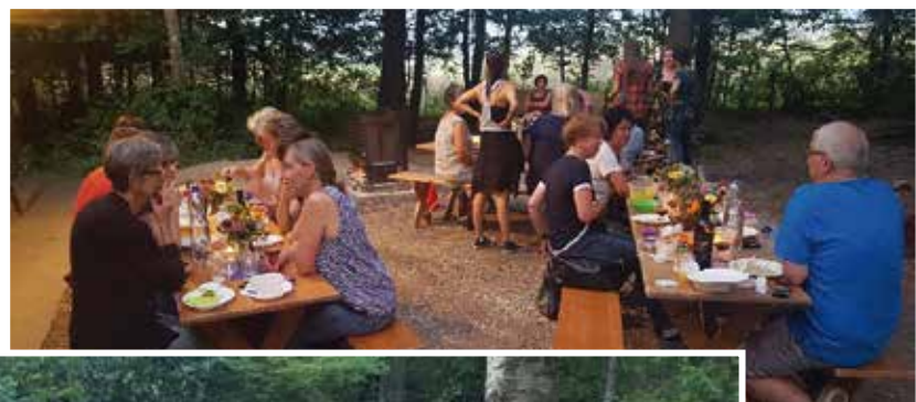
Sommeranlass, August 2019