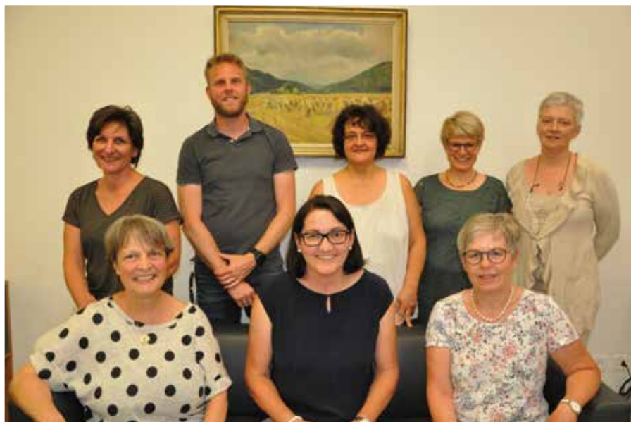
Vorstand anlässlich der Mitgliederversammlung vom Juni 2019